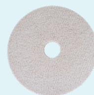
Upgrade pad #1

Gebruik bij een achterstand in vloeronderhoud de Upgrade pad #1 voor het schrobben. Voor onderhoud van de vloer naar behoefte, dagelijks of wekelijks, de vloer schrobben met de Cleaning pad.