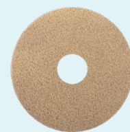
Upgrade pad #2

Gebruik de Cleaning pad voor dagelijks onderhoud. Als er een achterstand in het vloeronderhoud is ontstaan dan volstaat schrobben van de vloer met de Upgrade pad #2. De Cleaning pad is ook droog te gebruiken onder een high speed of ultra high speed machine. Het resultaat is een glanzende maar stroeve vloer.